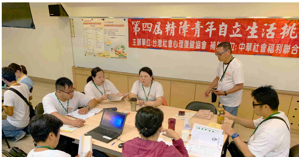
▲ 彼此針對目標互相討論發表意見。

理事長提到要讓精障青年們感受到「現實感」，在生活中給予找方法的方式，相信自己是具有實踐夢想的權利、能力以及自由，支持者們則從旁一起協助找到答案，當最有力的靠山，給予最大的支持與鼓勵。