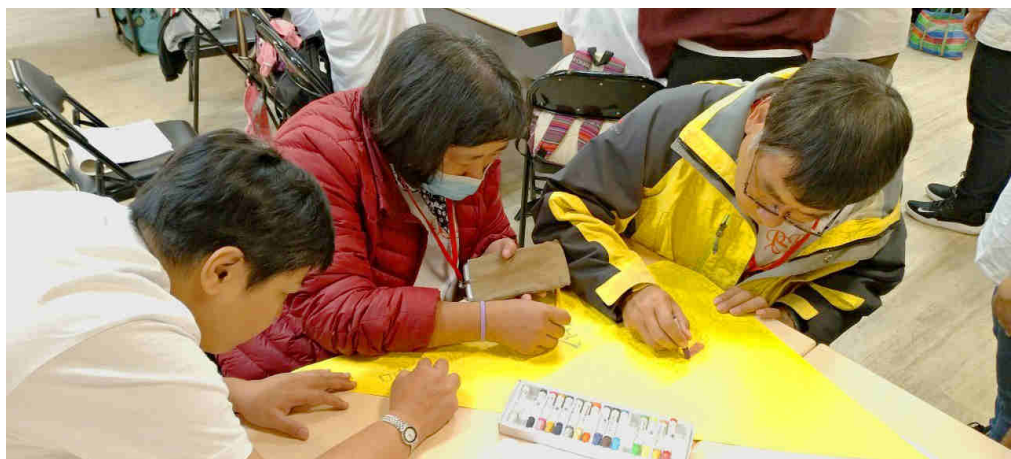
▲ 精障青年們彼此合作畫出代表自己對五的圖案。